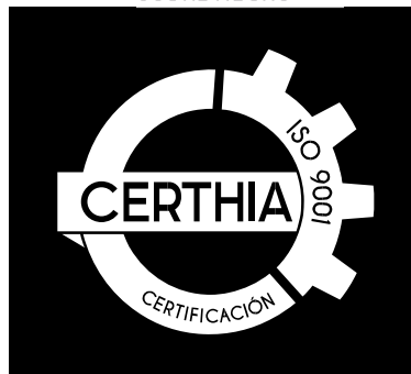
BLANCO SOBRE NEGRO