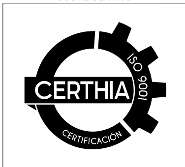
NEGRO SOBRE BLANCO