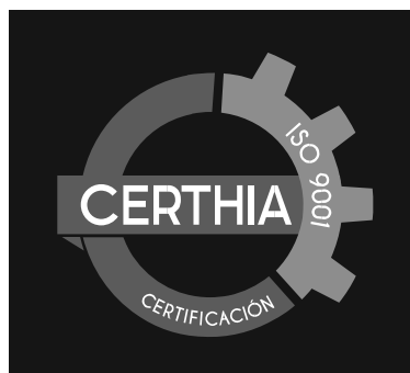
ESCALA DE GRISES SOBRE NEGRO